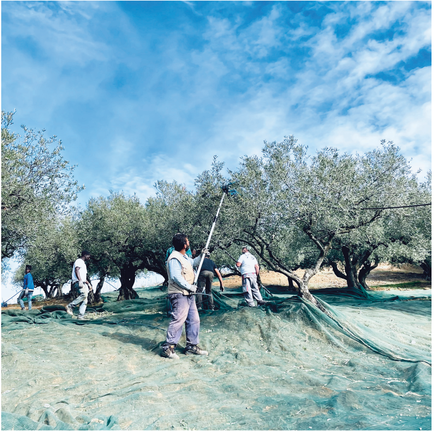
La raccolta delle olive a Pattipiccolo, Alcamo Olive harvest in Pattipiccolo, Alcamo