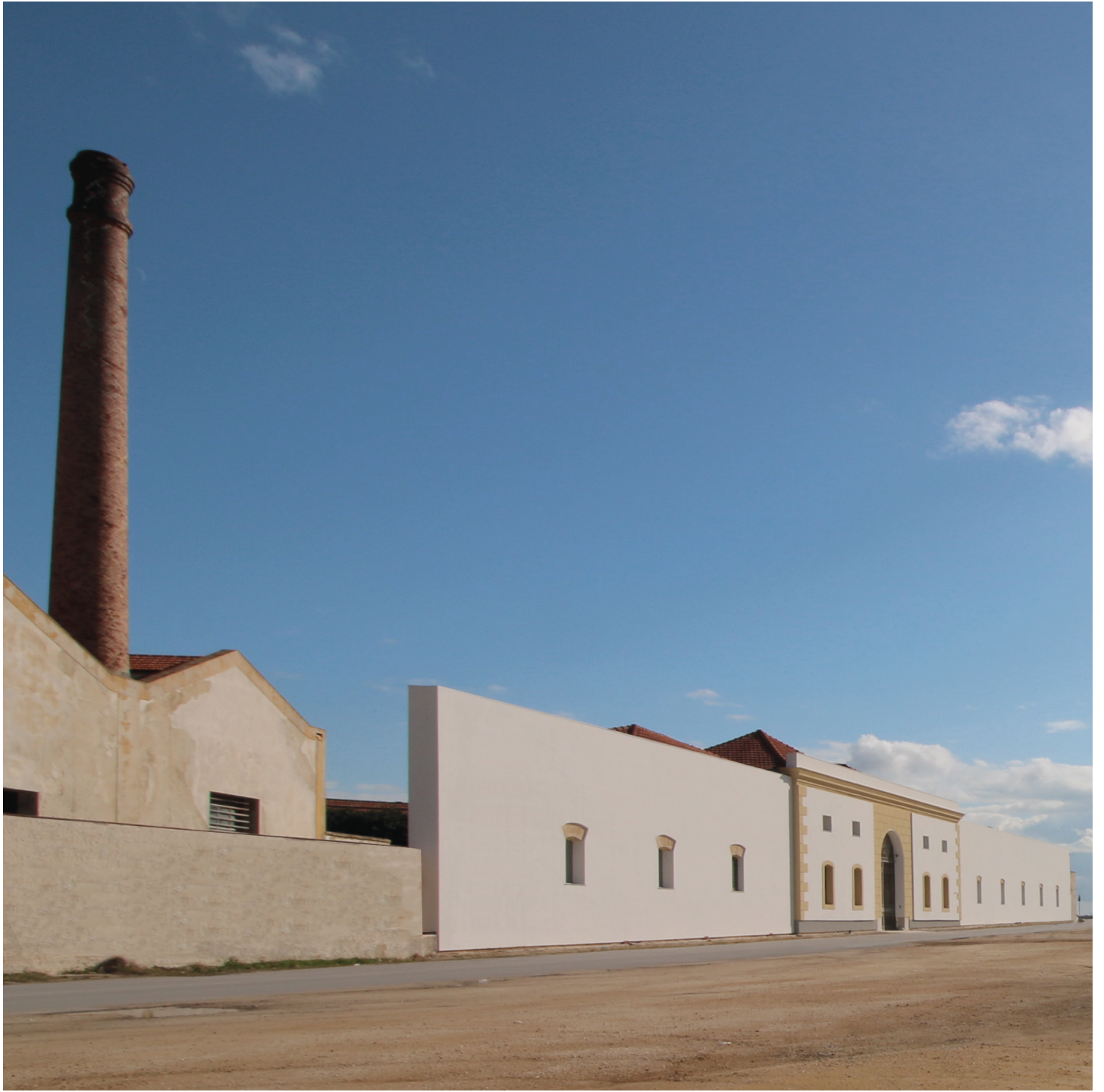
La Cantina, Marsala The winery, Marsala