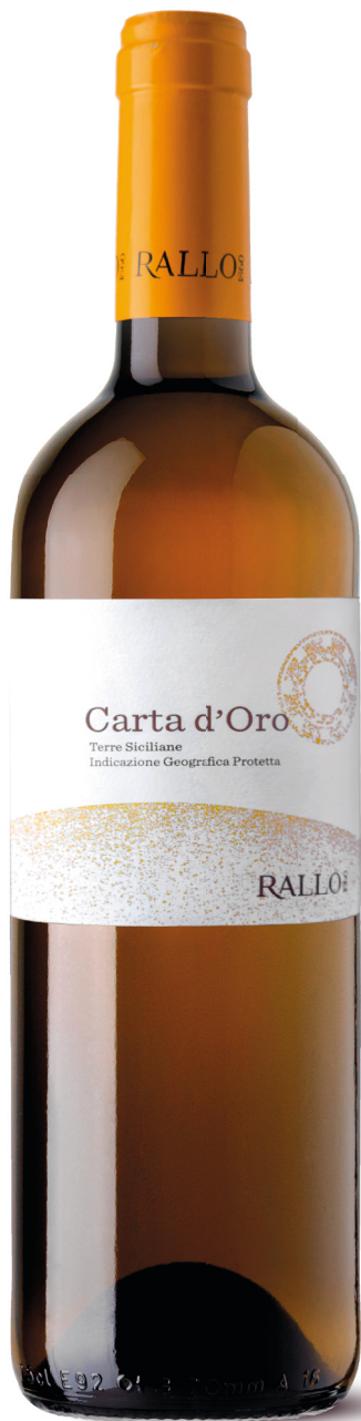
CARTA D'ORO blend di uve autoctone bianche BIO Terre Siciliane IGP/ Pattipiccolo - Alcamo