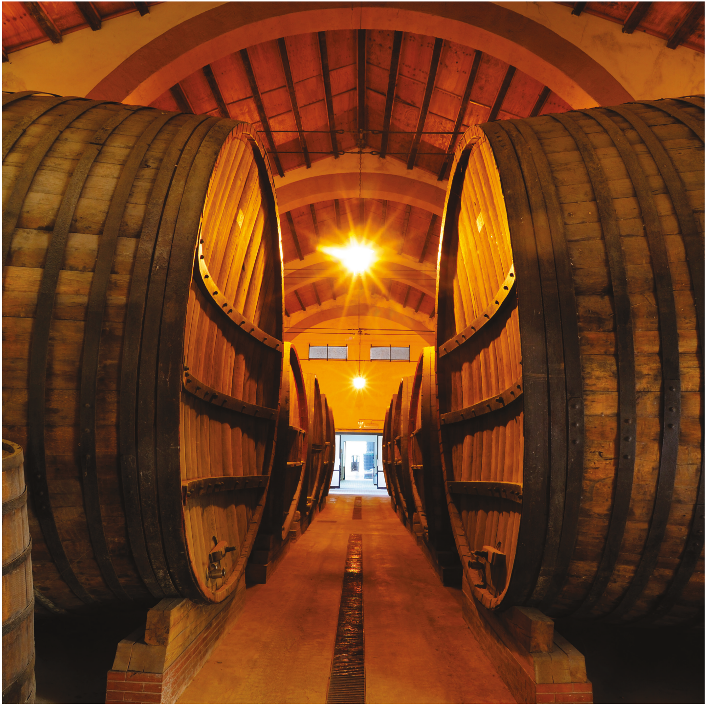
Bottaia storica, Marsala Historic barrels, Marsala