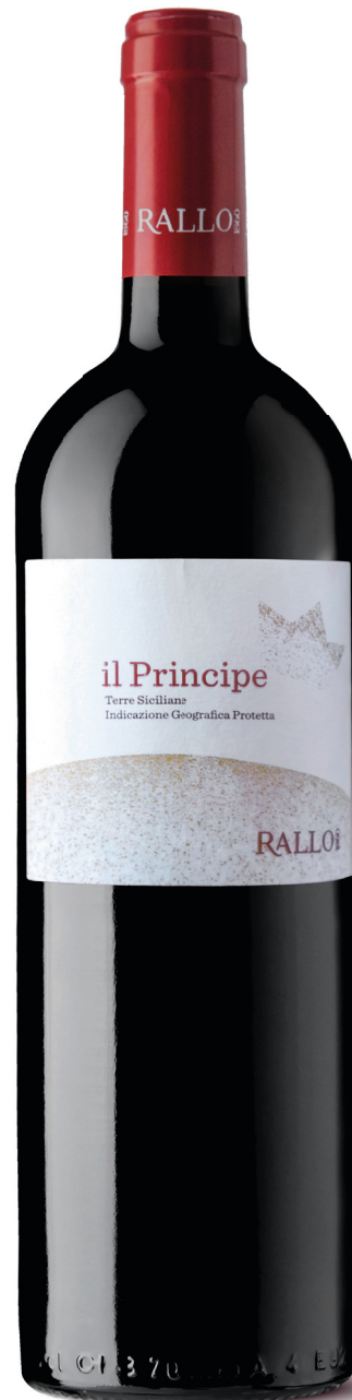
IL PRINCIPE blend di uve autoctone rosse BIO Terre Siciliane IGP/ Pattipiccolo - Alcamo