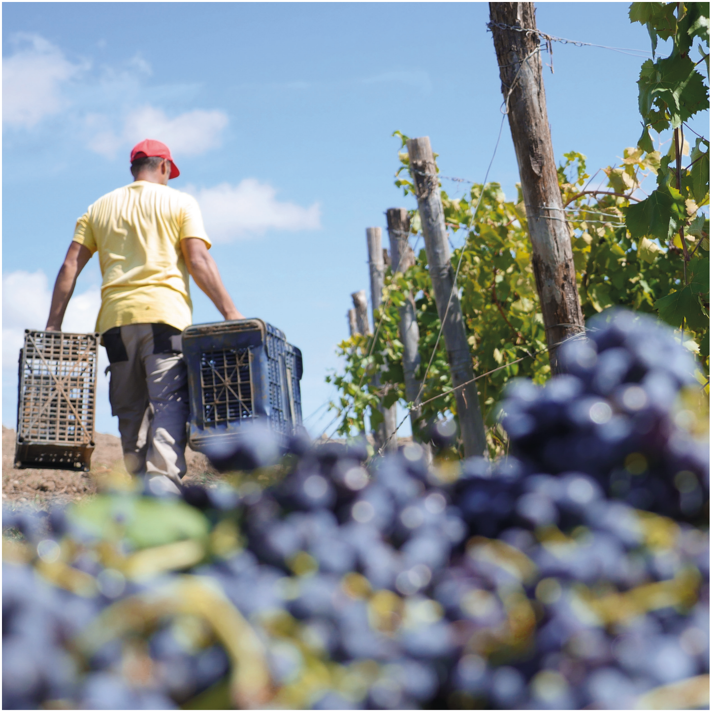
La vendemmia a Pattipiccolo, Alcamo Harvest in Pattipiccolo, Alcamo