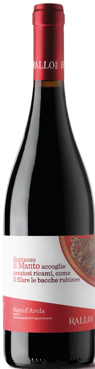
IL MANTO Nero d'Avola Bio Sicilia DOP / Pappiccolo - Alcamo