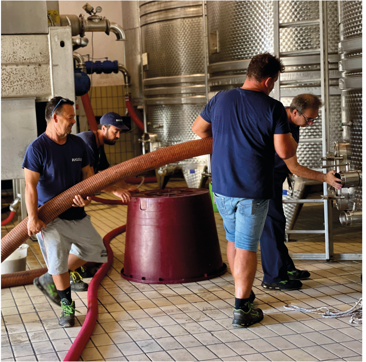
Uomini in Cantina, Marsala Men in the winery, Marsala